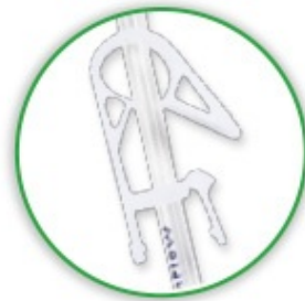
+ Z-MAN- Sicherheitsklemme

passiver Sicherheits- mechanismus zum Schutz vor adelstichverletzungen gemäß TRBA 250