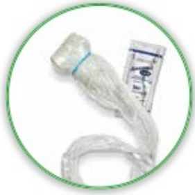
+ Sonderüberzug, Gel

Der Sonderüberzug und das sterile Gel gewährleisten eine hygienisch einwandfreie ultraschallgestützte Punktion