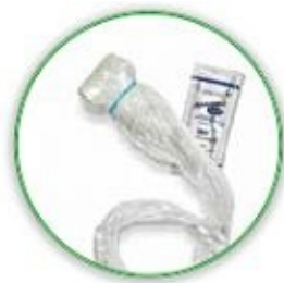
+ Sondenüberzug, Gel

Volltransparentes Lochtuch mit Peel-Off-System und optional vergößerbarem Lochausschnitt für mehr Schallfläche